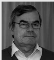
Hubert CHESNOT Contrôle de gestion